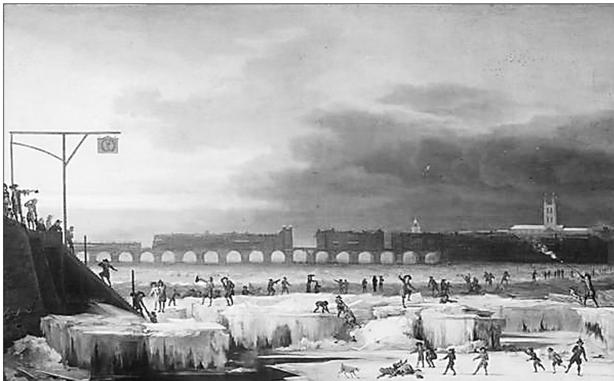
Абрахам Хондиус. Замерзшая Темза 1677 г.

Не только мороз был необычайно сильным, но и зимы были необычайно снежными. Снег мешал даже передвигаться по улицам. В декабре 1676 г. Эвелин сделал три следующие записи: «Выпал такой глубокий снег, что мешал нам возвращаться