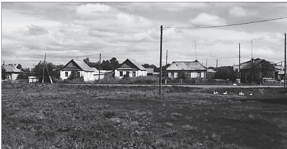
Село Таволожка рядом с церковью Всех Святых. 2005 г.

Полученные в процессе исследования сведения позволяют пересмотреть и существенно дополнить известные факты, а также восполнить пробелы в биографии С.Г. Ширяева, способствуют выявлению типичного и особенного в формировании одного из выдающихся борцов против самодержавия в России.