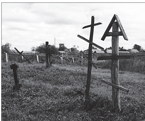
Кладбище, с. Таволожка. 2005 г.