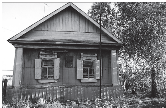
Дом, в котором в 1878 г. жили сестры В.Н. и Е.Н. Фигнер, с. Вязьмино. 2005 г.

Невозможно, даже живя в Саратове, представить себе, что за громадный город Лондон. Большинство улиц в нём