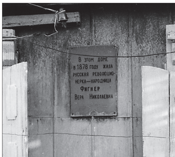
Мемориальная доска на доме, в котором в 1878 г. жили сестры В.Н. и Е.Н. Фигнер, с. Вязьмино. 2005 г.

короткие, пересекаются, перемешиваются, но есть улицы в 15 вёрст длиной. О том, как велик Лондон, можно судить уже и по тому одному, что несколько железных дорог проведено, чтобы ездить по нему в разных направлениях; я не знаю до сих пор сколько именно, но мне известны три дороги, из которых одна идёт по крышам домов, а другая под землёю, третья как следует. Кроме паровых железных дорог – множество конно-тягловых омнибусов.