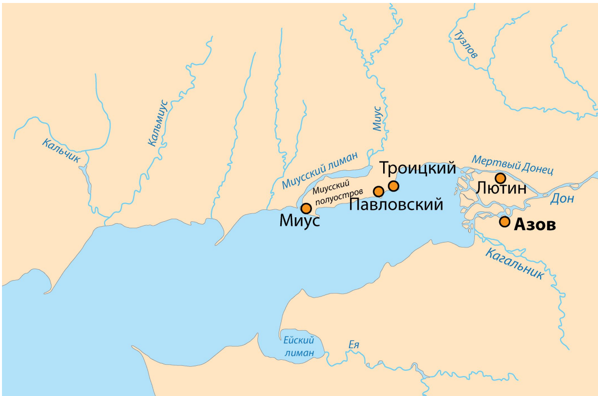
Рис. 2. Северо-Восточное Приазовье в конце XVII века