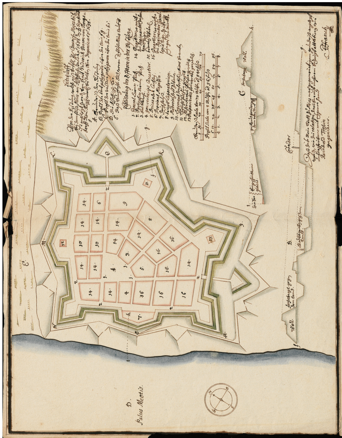
Рис. 1. Проектный план крепости Миус ("Entwurf von der festung, welche auß befehl Ih[re]s Szaarich[en] Mayjestät beejm fluß Mius am Assoffischen Meer a[um] 1698 den 1/11 September..."). Э. Ф. фон Боргсдорф. Ок. 1698 г. Копия, современная оригиналу.