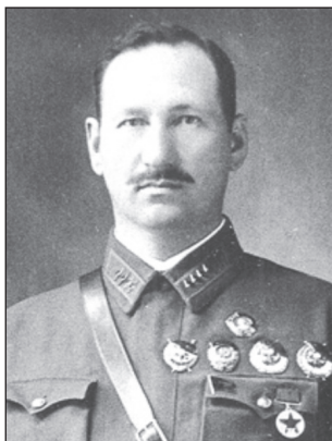
М. Г. Ефремов